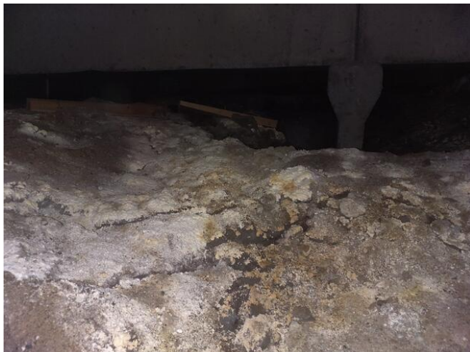
Påväxt i grunden