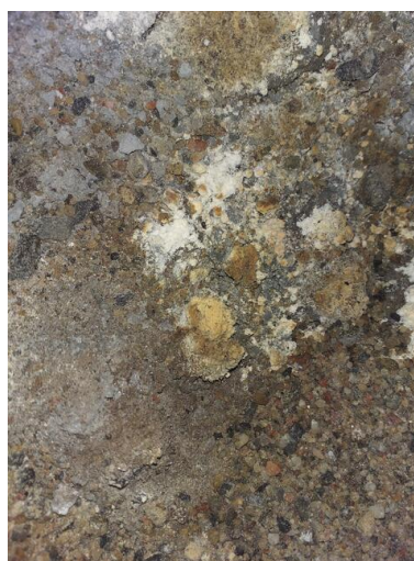
Påväxt i grunden