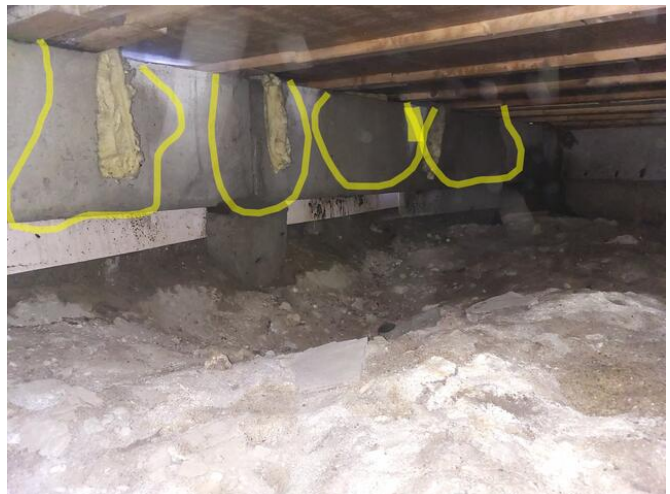
Vattenrosor efter att vatten har runnit in utifrån via ventilationsgaller