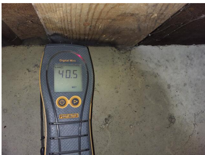
Hög indikering i bräda under hus pga av att vatten har runnit in utifrån via ventilationsnät mellan hus och grund